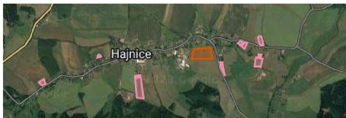
Mapa požadavků na využití území